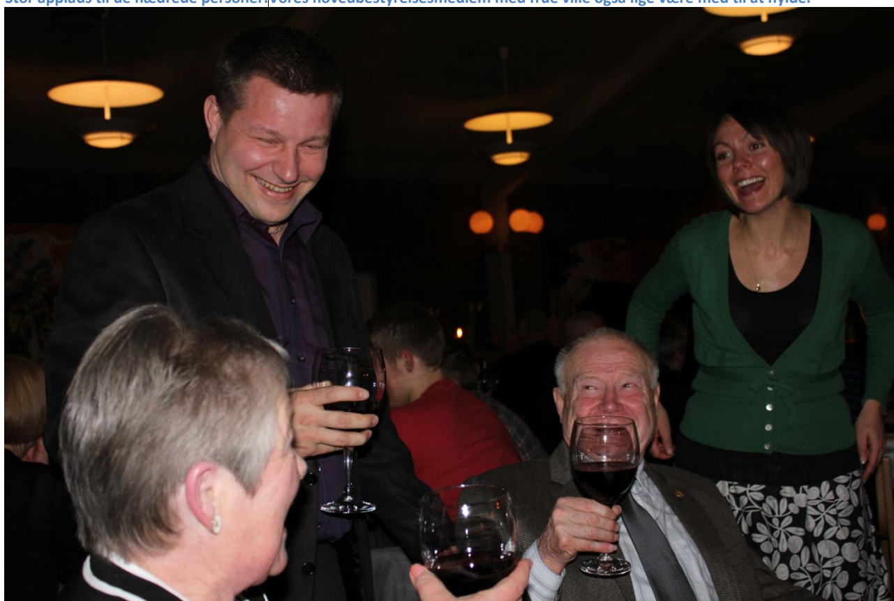
Vores hovedbestyrelsesmedlem med frue ville også lige være med at hylde Gulddrengen.