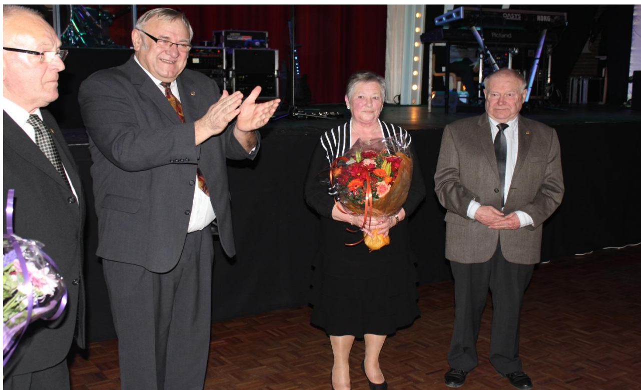
Stor applaus til de hædede personer. Vores hovedbestyrelsesmedlem med frue ville også lige være med til at hylde.