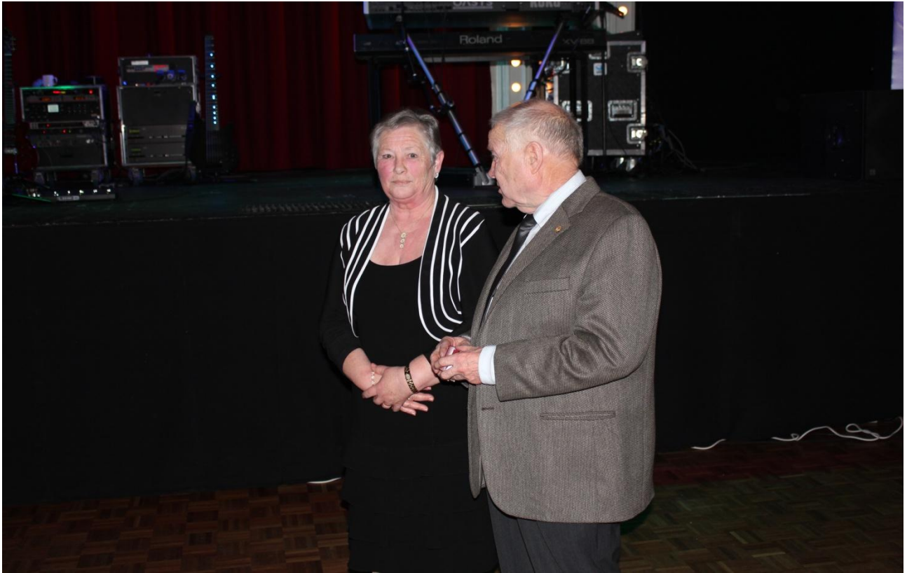
Man er vel lidt rørt over situationen.